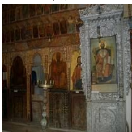
монастырь Святого Барнабаса (комната икон)