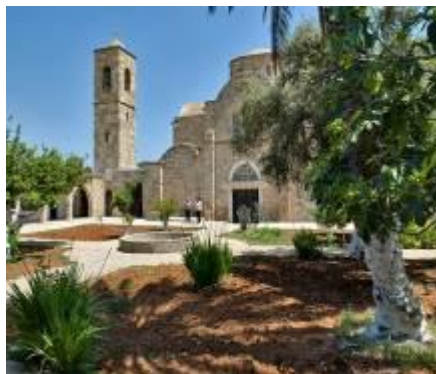
монастырь Святого Барнабаса