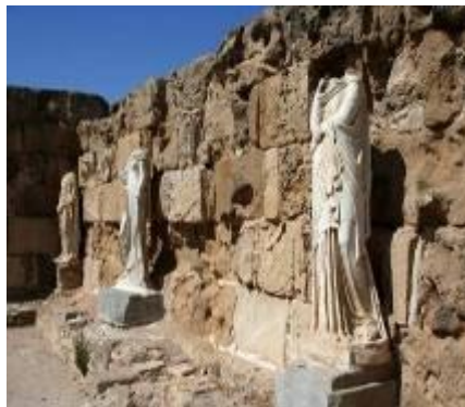
античный город Саламис